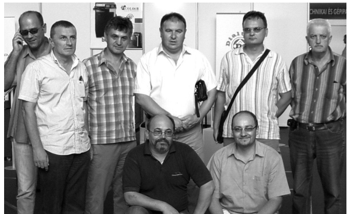
Predstavnici pijačnih uprava iz Srbije na III Međunarodnom i regionalnom sajmu privrede

- Nažalost zbog viznog režima manji broj ljudi nas posećuje, no nadamo se, da će za državljane Srbije uskoro ukinuti vizni režim, i u tom slučaju i čitaoci „Informatora” će se lakše uveriti u kvalitet usluga, koje pruža Banja „Eržebet”.